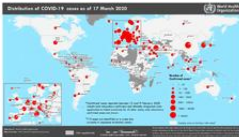
Distribution du Covid-19 au 17 mars 2020 (la légende de cas confirmés est observée avec les bulles rouges). Sources (OMS Coronavirus disease 2019 (Covid-19) Situation Report – 57).

Étant donné le manque de thérapie antivirale efficace contre Covid-19, les traitements actuels sont principalement concentrés sur le soutien symptomatique et respiratoire. L'OMS recommande l'oxygénation par membrane extracorporelle (ECMO-respirateur artificiel) aux patients souffrant d'hypoxémie réfractaire (Bajema KL et al). Des traitements de secours avec plasma de convalescence et immunoglobulines G sont délivrés à certains cas critiques en fonction de leur état clinique (Chen L et al).